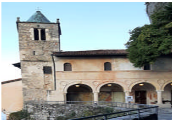
Eremo di Santa Caterina del Sasso

Via Ortigara, 8 – 21012 Cassano Magnago (VA)